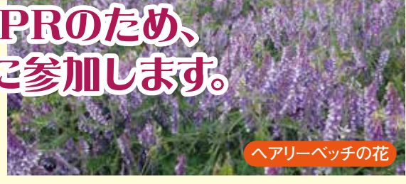
ヘアリーベッチの花

兵庫県環境部環境政策課が進めている“ひょうご1.5℃ライフスタイルの普及啓発”活動の一環として行われるイベントに、JAあかしの花美人のPRを図るため参加します。参加予定のイベントおよび内容については、下記の通りです。