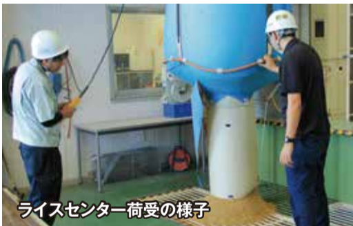
ライスセンター荷受の様子

9月に収穫された新米キヌヒカリは、現在、農産物直売所「フレッシュモア」3店舗およびJAファーマーズプラチナフレッシュモア江井ヶ島にて9月20日より販売を行っています。ヒノヒカリおよび花美人は今月の収穫作業後、順次販売を開始する予定です。是非、お買い求めください!