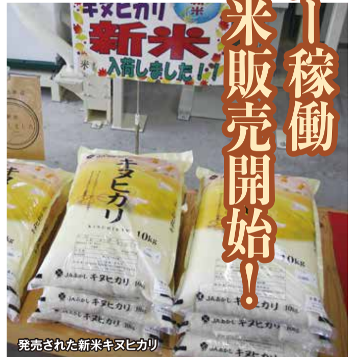
発売された新米キヌヒカリ

収穫の秋、今年も管内でお米の収穫時期を迎えています。今年は9月5日よりライスセンターを稼働し、キヌヒカリの荷受を行いました。今年の気温は、7月下旬以降平年よりも高い日が続いたため、昨年同様高温障害が発生しました。また、気候変動により、梅雨明け以降の降水量は少なく、8月下旬に台風が列島を縦断したため、まとまった降雨がありました。稲の倒伏が心配されましたが、影響はなく、安堵しております。