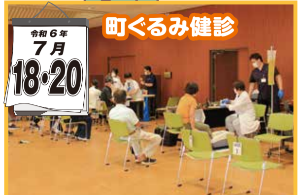
令和6年 7月 18・20日 町ぐるみ健診

農産物直売所フレッシュ・モア大久保店に隣接するほ場で、スイートコーン収穫体験を開催しました。JAあかしの利用者を対象に開催され、若年層のご家族を中心に43名が参加しました。イベントは株式会社クローバーファームJAあかしが中心となり運営。大人の背丈ほどある草丈の中で、ご家族で力を合わせて楽しそうに収穫する様子が印象的でした。今後も農業イベントを通じて、利用者や地域への貢献に努めてまいります。