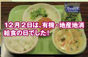
12月2日は、有機・地産地消給食の日でした!