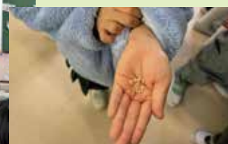
「玄米が宝石みたいで綺麗！」と見せてくれました。

地元の農家さんが大切に作ってくれたお米です。「いただきます」と感謝を忘れずたくさん食べてくださいね。